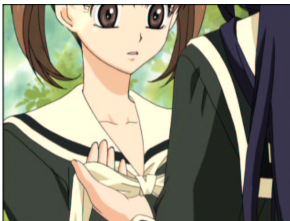
図 1.1: かた結びにしてみようかしら？