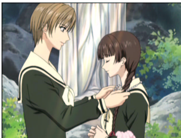
図 1.27: お嫁にしてください.....

さすが由乃さんというか、この従姉妹と言うか、普通は気まずいんでしょうけど、見事に復縁です。