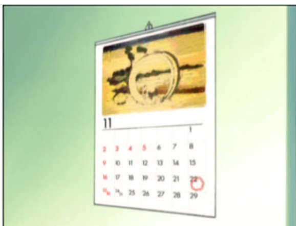
図 1.24: 惑星リリアンのカレンダー

ここに謎なカレンダーがかかっています。土曜始まりの11月は2003年ですが、祝日が全然違います。それに11月は30日までです。この祝日は、2004年5月のものです。5月なら31日までありますし。