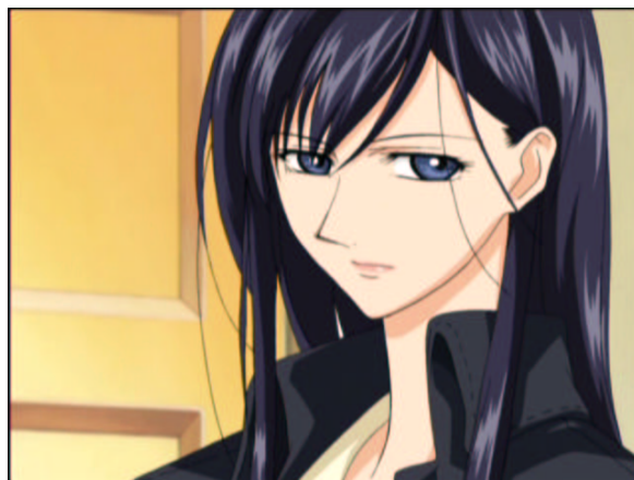
図 1.38: 護鬼厳夜吁

処で、ずいぶん回しにくそうなドアノブの握り方してますね> 祥子さま 目つきが厳しい