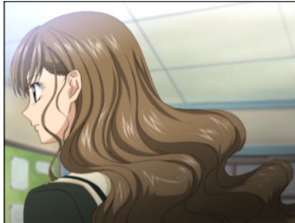
図 1.2: つんとおすまし、君は誰？