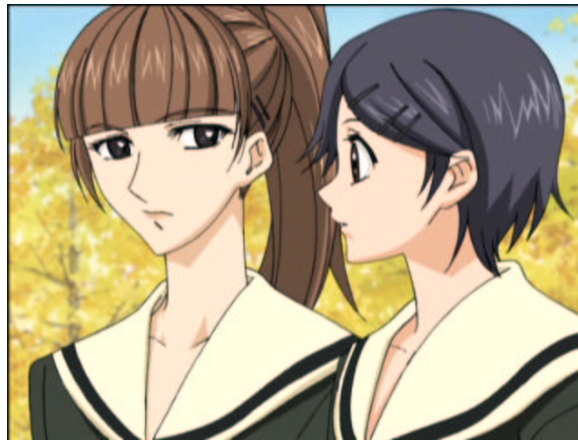
図 1.6: 新聞部～会議～