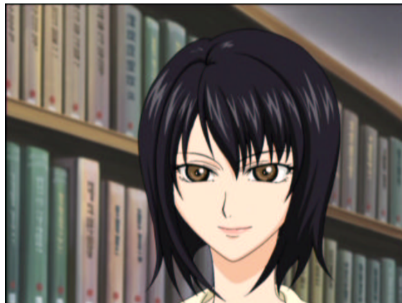
図 1.29: かき氷が嫌いなの