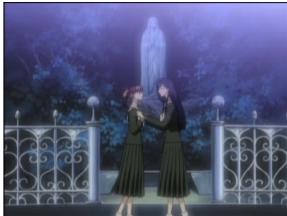
図 1.15: 駄目よ、マリア様がみてるわ...

今回の一件で、祥子も、やっぱり自分には祐巳しかしないと気づいたんでしょうね。たまたま最初に目にした1年生ではなく、本当に必要な妹。二人の絆は信頼し合った、強固なものとなるでしょう。