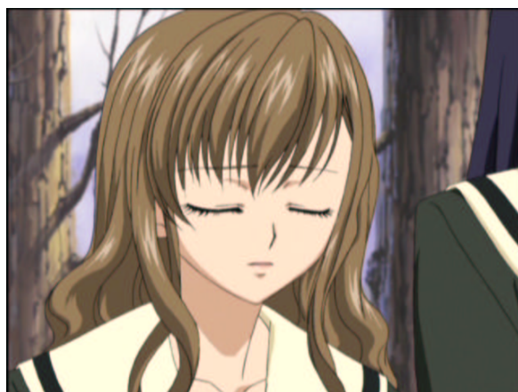
図 1.34: 私にもキスして欲しい.....