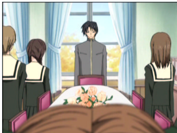
図 1.10: 光輝く G ストーン 地球の希望守るため

原作だとこの時点では単に場慣れしているだけですましていますが、単に女性に囲まれても何も感じないだけなような。