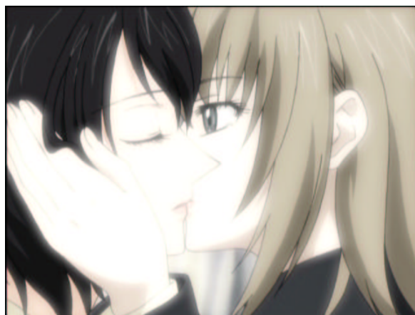
図 1.33: キス・キス・キス・キスをし〜て〜

テレ東規制は大丈夫なんですか？(^.^; 「いばらの森」の件があったので心配していましたが、多少はしょってはいれるもののしっかりとやってくれました。今回最大の目玉です。