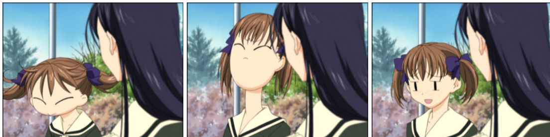
図 1.25: こいつ、人間？