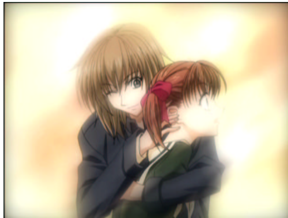
図 1.37: 胸は固いけど、他は柔らかい.....