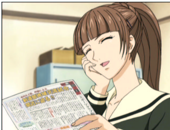
図 1.17: なんて素晴らしい あ・た・し