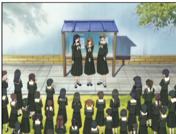
図 1.32: 薔薇さま補完計画