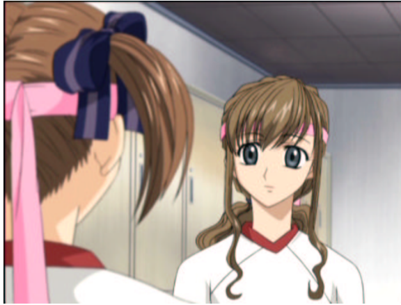
図 1.35: ジャージの下には是非ブルマを

原作だと、襟付き半袖にスパッツですが、襟なし長袖となっております。最も、「レディ、GO！」の表紙も襟がないようですが。