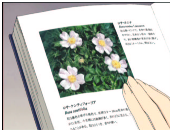
図 1.30: ロサ・カニナ

桃薔薇です。桜薔薇です。黒薔薇じゃありません。5枚の花びらで、ぱっと見た目薔薇じゃなくて普通の花に見えます。本当に色々な花があるようですね。