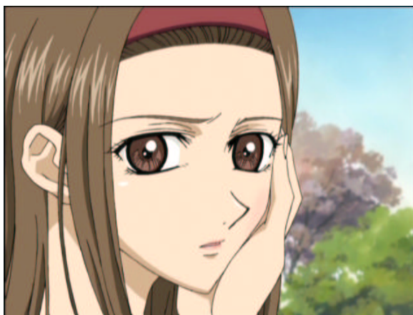
図 1.21: 初めてで、痛いの.....

原作だと ロサ・フェティダ 黄薔薇を探しに行くと、靴箱で会うんですが、たまたま遇います。誰かに頬を叩かれたのか、左頬が腫れています。さらに、上履きで歩いています。ただ、リリアンでは上履きで外を歩くのは一般的に行われているようですが (^_^;