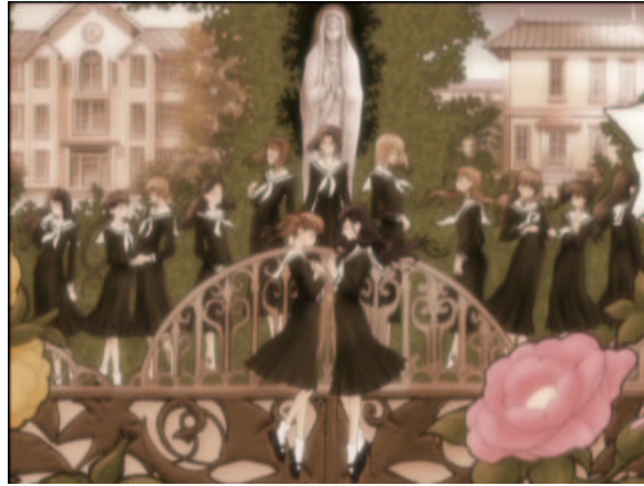
図 1.22: あなたは誰？