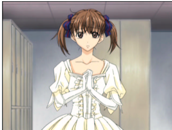
図 1.12: 灰被り

なんかやつれてるというか (^.^; しおれてるんですけど (^.^;; 胸元が開きすぎ