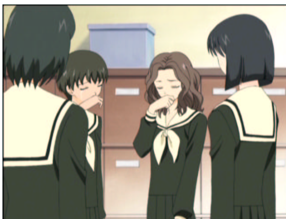
図 1.20: 私は駄目な妹...