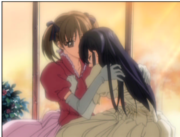
図 1.14: やっぱり、クッションが欲しいわ...

おそらく親にも見せない、見せられない涙でしょう。全てを祐巳にさらけ出します。自分で気づいているのかいないのか、姉妹は祐巳以外にはあり得ません。