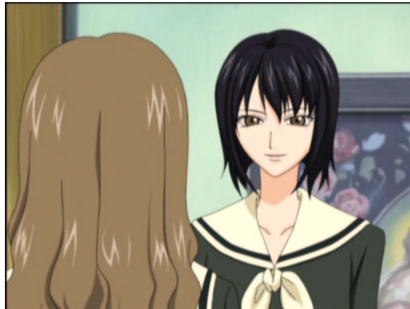
図 1.31: 女の闘い

静さまが単純に「 ロサ・ギガンティア 白薔薇の座を譲ってくれ」と言ってきたのなら、志摩子さんは受け入れたかもしれないですね。