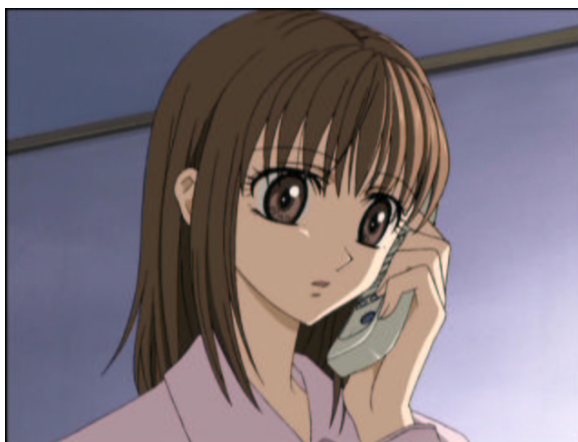
図 1.23: この娘、誰？