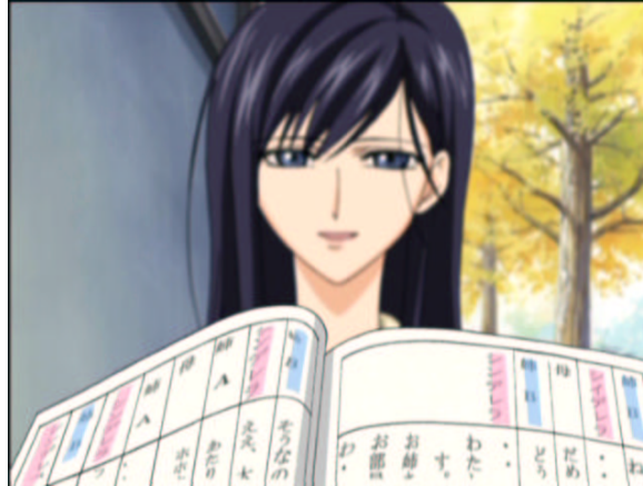
図 1.9: 覚えておかないと酷いわよ

シンデレラの意地悪なお姉様は祥子さまの方が合ってるのでは？ まさか先週の予告は本当に予告だった!?