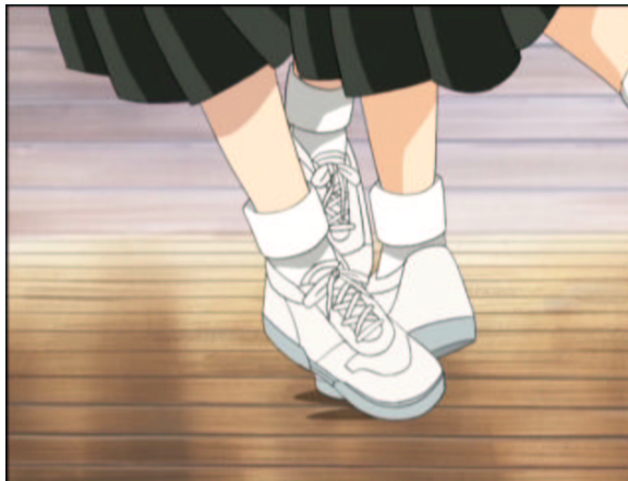
図 1.8: 送り足払い

初めてでそれだけ出来れば良いのでは？ 原作だと靴下なのに、みんな上履き履いてます。踏んだら痛いでしょうね。