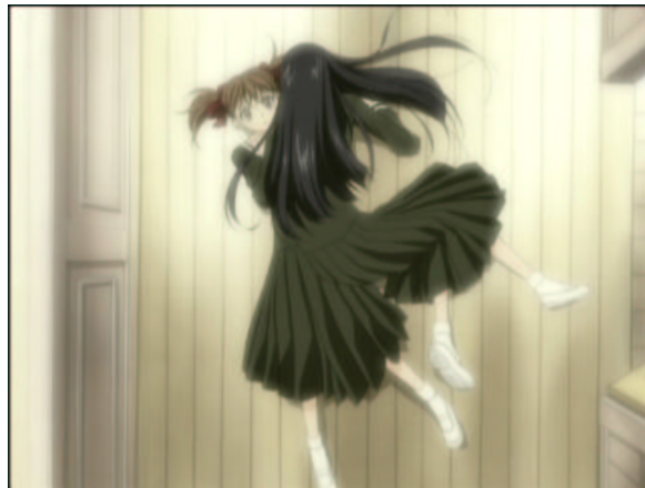
図 1.4: 祐巳、大人しくしなさい！ 痛くないから...

65D の胸で押し倒します。見ず知らずの少女を押し倒すとはなんと大胆な(違 # 祥子様の胸は バスト 83cm と推定。