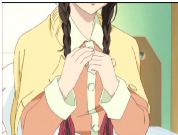
図 1.26: 祐巳さんよりはあると思うわ

ガーゼを外す音が生々しいです。アニメではテレ東規制で描かれてないですが、原作だと右胸の下を 10cm 切っています。