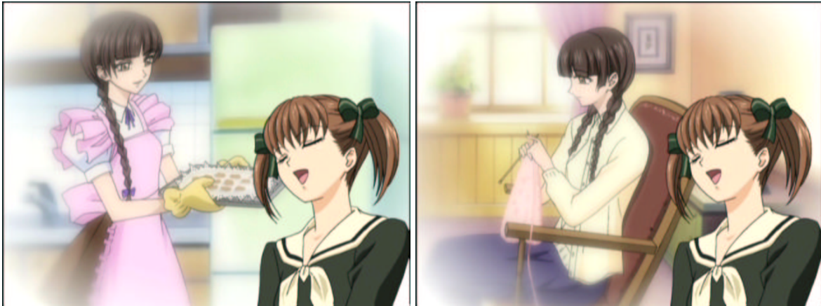
図 1.18: 猫被り

少し病弱で、守ってあげたいタイプ 病弱ってのは事実だろ。 フリルの付いたエプロン