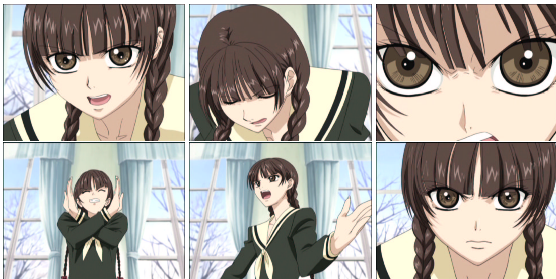
図 1.36: クロスチョコップの出し方講義