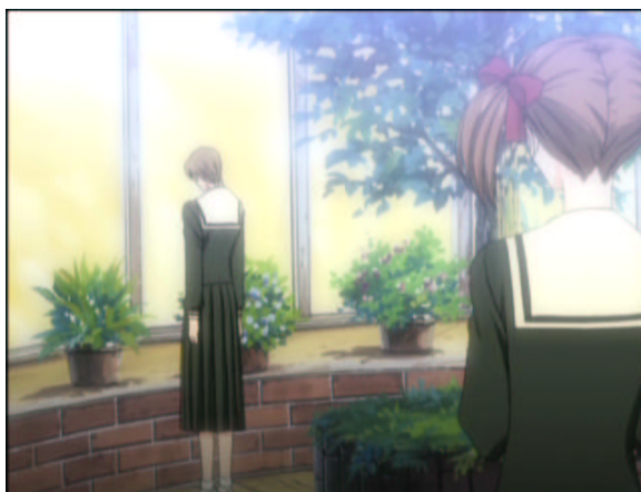
図 1.19: 温室の中心で由乃と眩く