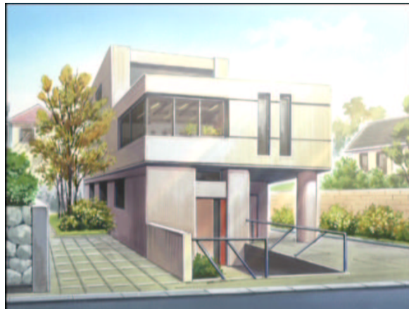
図 1.5: 福沢社長宅