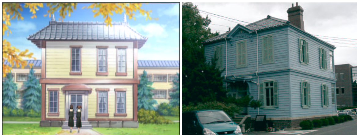
しゃちほこ 図 1.3: 鯨 付き