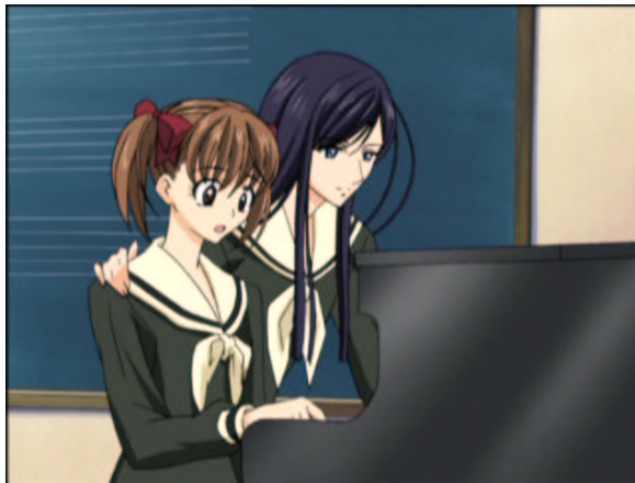
図 1.7: あなた、肩が凝っていてよ